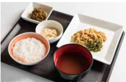
目安栄養量：1日 1400kcal程度（主食全粥の場合）

「歯ぐきでつぶせるかたさ」を目安に仕上げたお料理をさらに細かく刻んだお食事です（極キザミ状）。上下の歯ぐきですりつぶす程度の力があり比較的嚥下状態が良好な方向けのお食事です。義歯が合わない方や、咀嚼に不安がある方のお食事をサポートします。