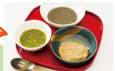
目安栄養量：1日 900kcal程度（主食ミキサー粥の場合）

「べたつかずまとまりやすいミキサー食（やわらかい粒等を含む不均一なもの）」に分類されるお食事です（ペースト状）。下顎と舌による食塊形成能力があればお召し上がりいただけます。ソフト食と異なり、ざらっとした食感を少し残してあります。