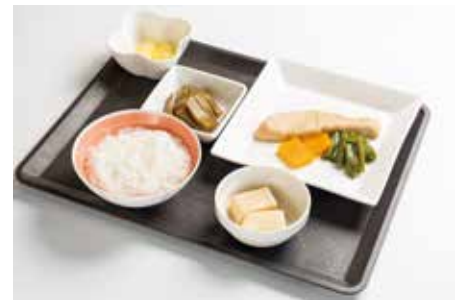
目安栄養量：1日 900kcal 程度（主食ミキサー粥の場合）

通常のお食事をミキサーにかけ、ゲル化剤を加えて成形したお食事です。お料理をミキシングし丁寧に漉したあとに成形するため、分類上「離水の少ないゼリー・プリン・ムース（たんぱく質含有量は問わない）」に該当する滑らかなゼリー食です。「舌でつぶせるかたさ（20kpa）」をクリアするかたさで、残存歯の少ない方や咀嚼力が低下した方にもお召し上がりいただけるお食事です。（若干の食塊保持と送り込み能力が必要です。）